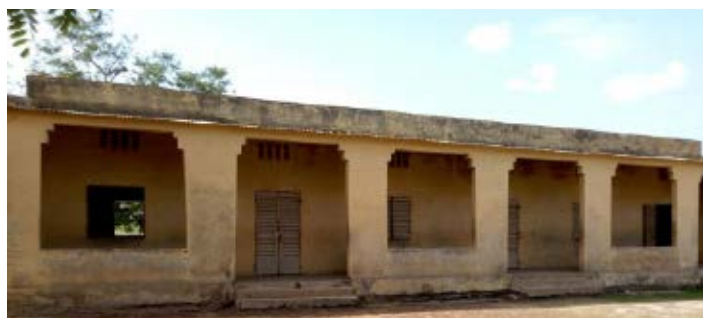
Colegio de Djiguidala

5.- Nueva clase en Ouoronina. Esta construcción es necesaria teniendo en cuenta que la escuela tiene 299 estudiantes y sólo 4 clases. Sus medidas serían: longitud 9 m y ancho 7 m, con un espacio delantero de 2 m que sirve de pasillo para entrar al aula.