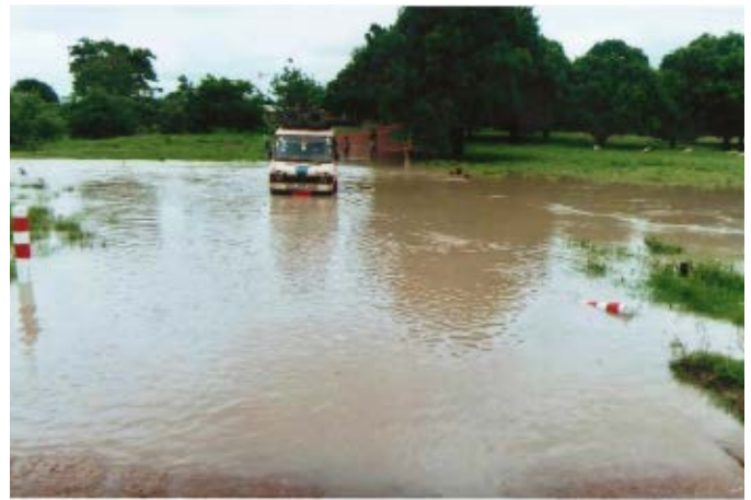
Badén de acceso a Tema donde iría el puente

La superficie del puente actual es de 24 m 2 , 12 m de largo por 2 de ancho. El cauce transcurre a 70 cms por debajo de éste, pero, en época de lluvias, el agua sobrepasa los 80 cms por encima del puente lo que hace muy difícil y peligroso su tránsito.