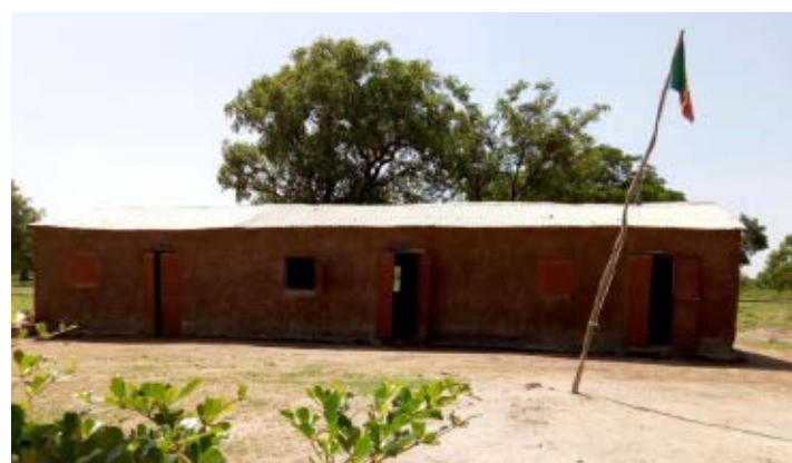
Colegio de Nankilabougou