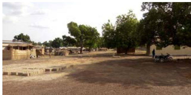
Vista general de Djiguidala

Total de la obra: 5.098.799 fcfa (7.772,92 €)