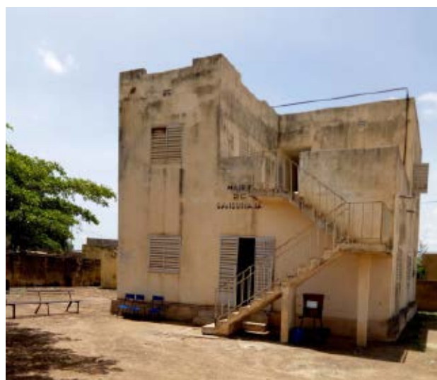
Ayuntamiento de Bancoumana