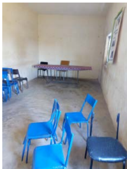
Salón de juntas del Ayuntamiento

3.- Compra de 10 ollas grandes para las mujeres de la localidad de Bancoumana.