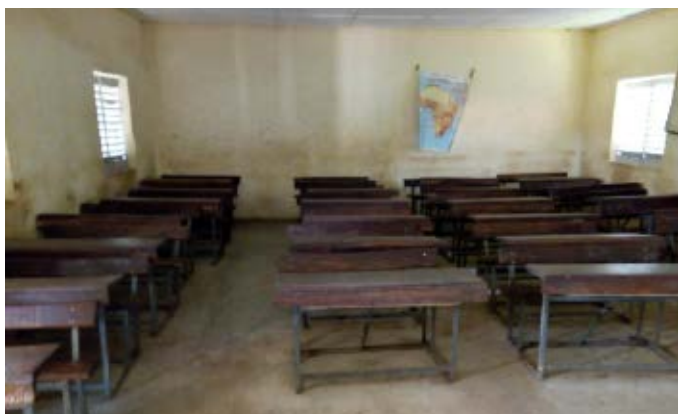
Colegio de Ouoronina